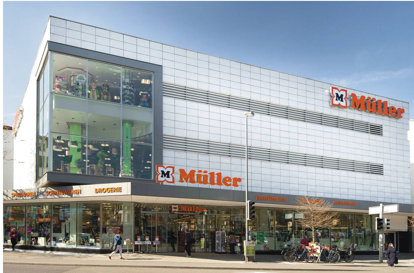
Heidelberg | eröffnet Oktober 2013, Verkaufsfläche 2500 m 2 , Sortimente: Drogerie, Parfümerie, Spielwaren, Schreibwaren, Strümpfe, Handarbeit und Naturshop