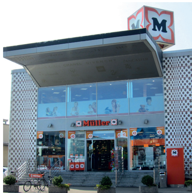
Zagreb | eröffnet Oktober 2013, Verkaufsfläche 1750 m 2 , Sortimente: Drogerie, Parfümerie, Spielwaren, Schreibwaren, Strümpfe, Handarbeit und Naturshop