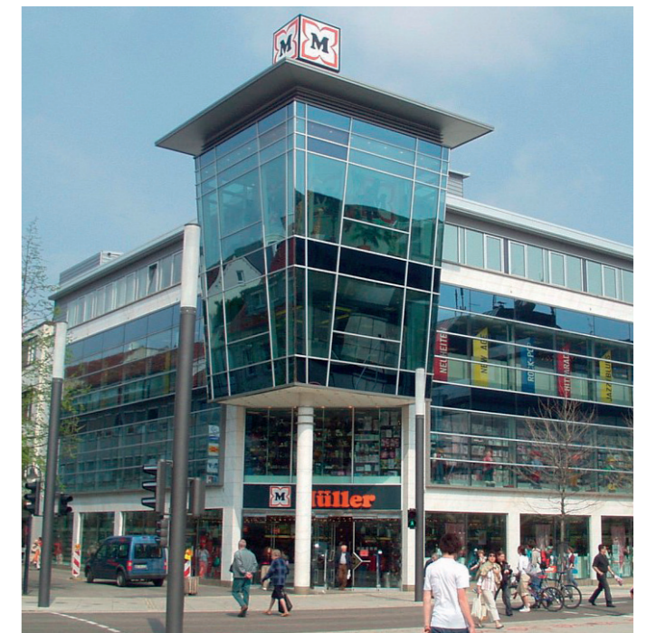
Unsere Filiale in Heidenheim (eröffnet März 2002).

Wir möchten Sie einladen: Begleiten Sie uns auf den folgenden Seiten bei einer besonderen Erfolgsgeschichte und lernen Sie die Zutaten kennen, die aus einem Einkauf ein Erlebnis machen.